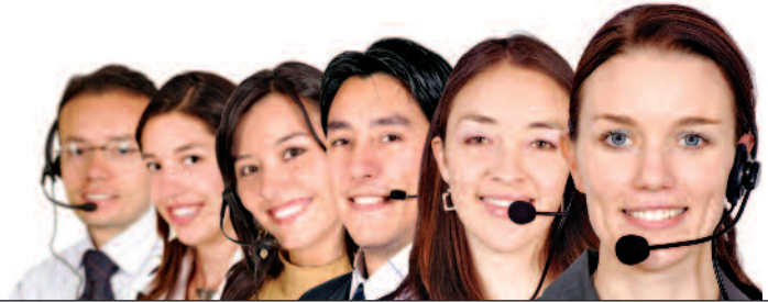
Tableau de bord des normes de service (Période : 1 er octobre 2009 au 30 septembre 2010)